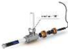
Рис. 2 - Схема прямого ввода нагревательной секции внутрь трубопровода