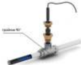
Рис. 3 - Схема ввода нагревательной секции внутрь трубопровода под углом 90°